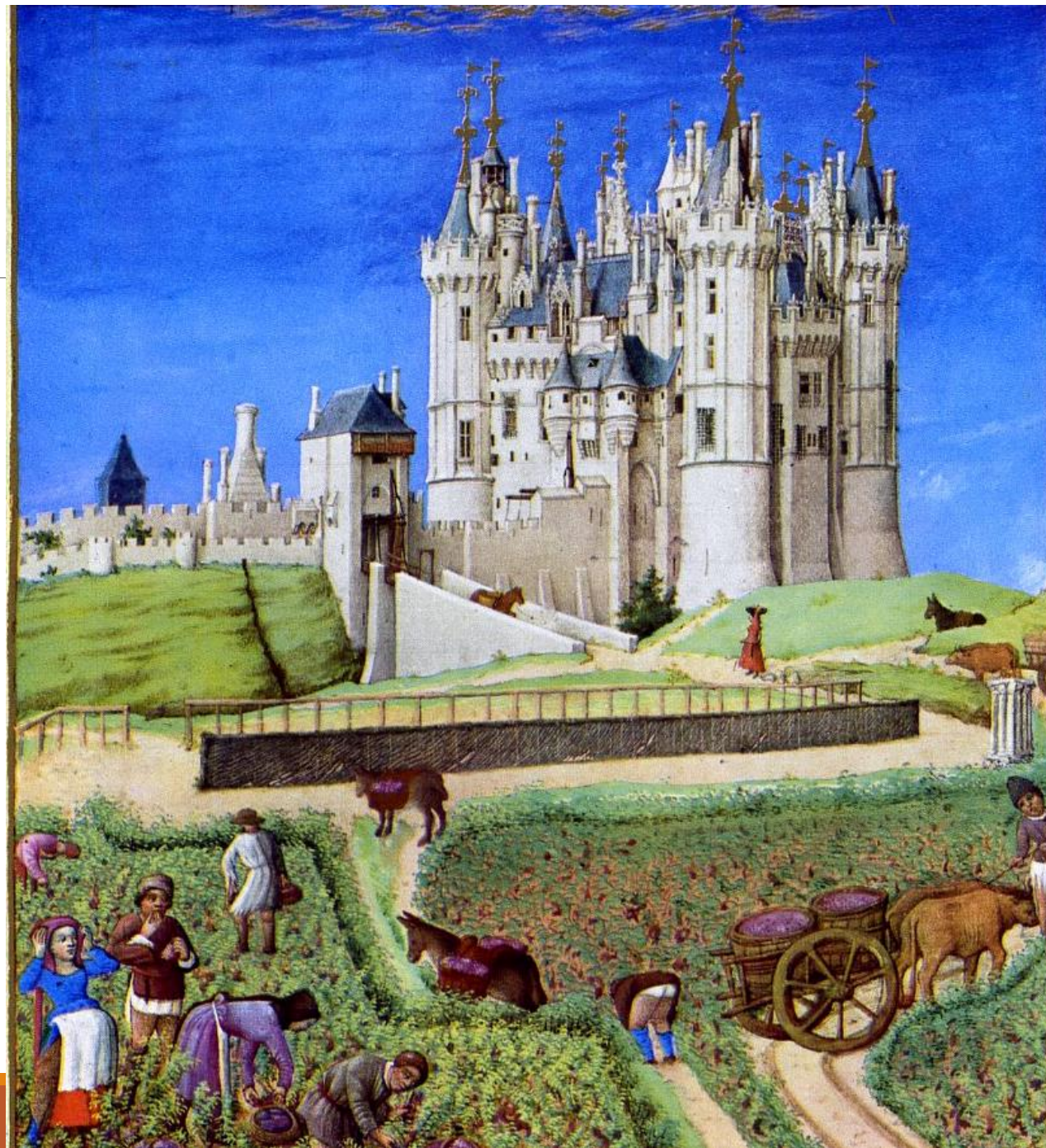
Miniatura de Las muy ricas horas del Duque de Berry, de los hermanos Limbourg. (1410)